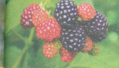
Ostružiny str. 79