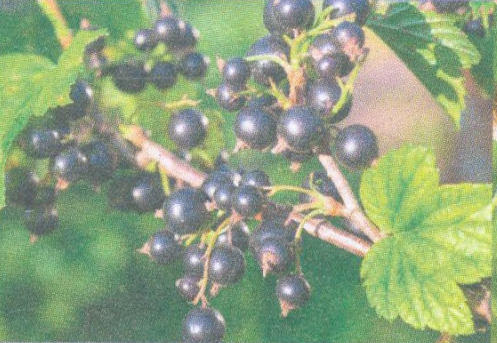
Rybíz str. 107