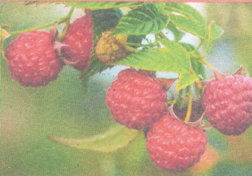
Maliny str. 99