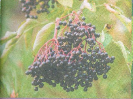
Černý bez str. 103