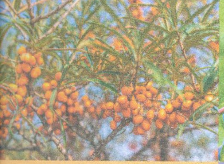
Rakytník str. 115