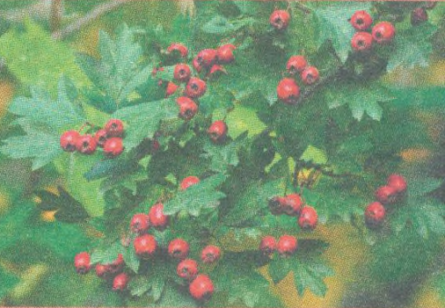
Hloh str. 123