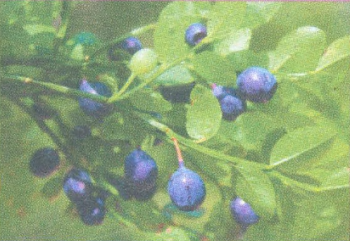
Borůvky str. 95