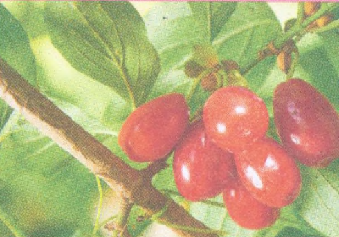
Dřín str. 111