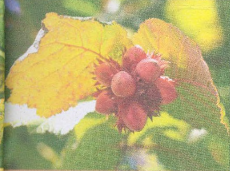
Lískové oříšky str. 91