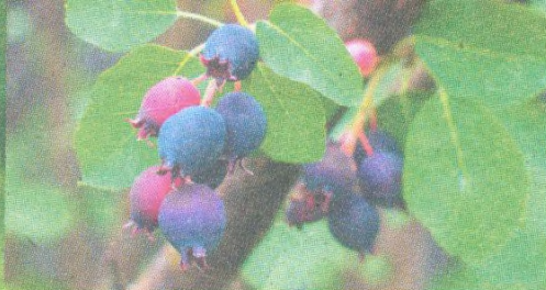
Muchovník str. 83