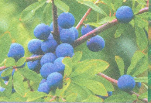
Trnka str. 119