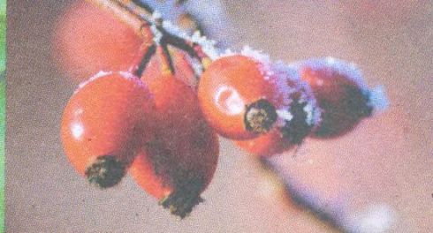
Šípek str. 87