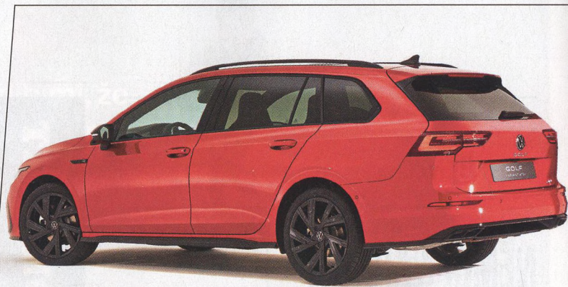
Volkswagen Golf Variant