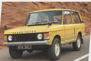
50 let Range Roveru I