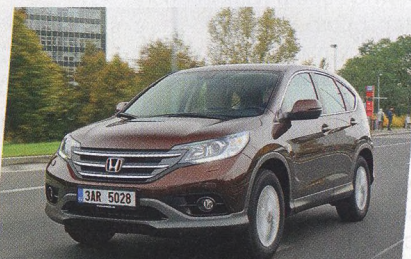
Bazar: Honda CR-V