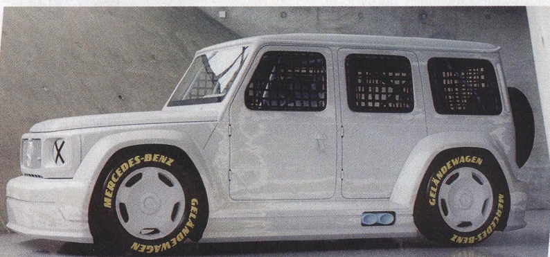
Mercedes-Benz G by Abloh and Wagener