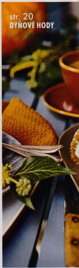
str. 20 DÝŇOVÉ HODY