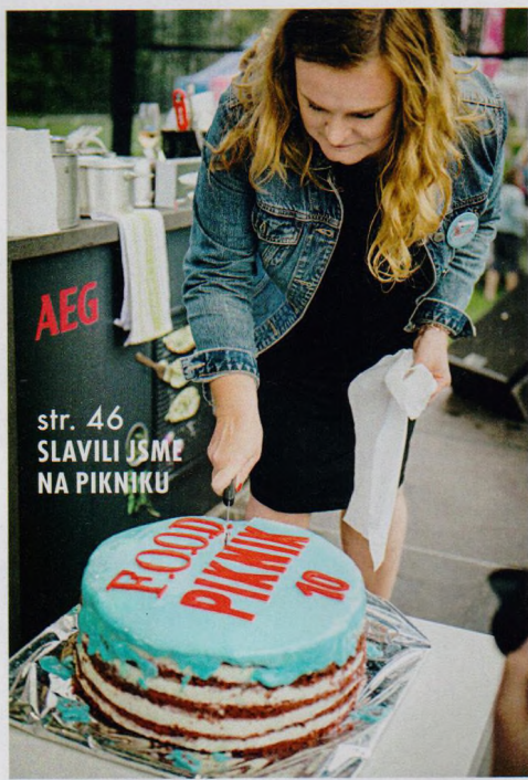
str. 46 SLAVILI JSME NA PĪKNIKU