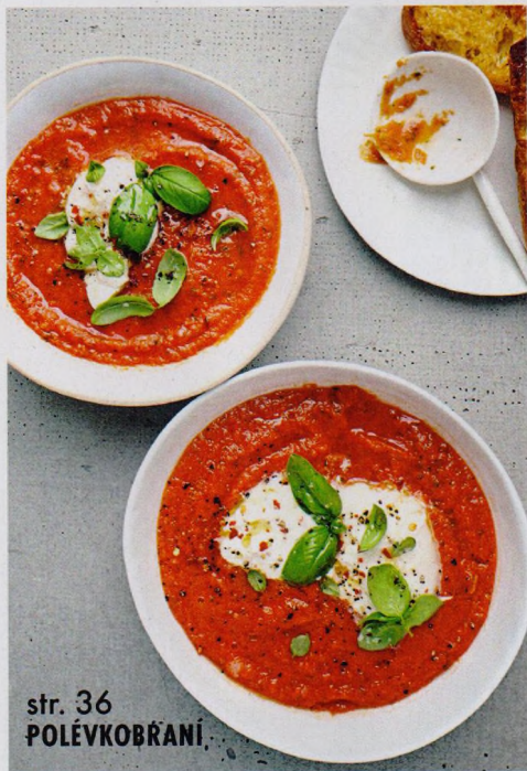
str. 36 POLÉVKOBRÁNĪ