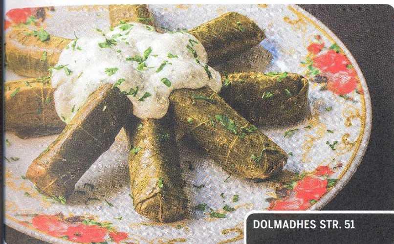
DOLMADHES STR. 51