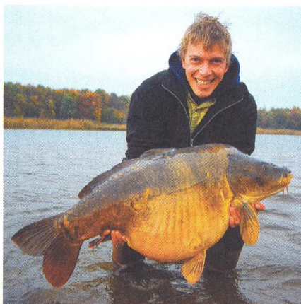
18 S pravdou ven! / úspěšné strategie vnaďení