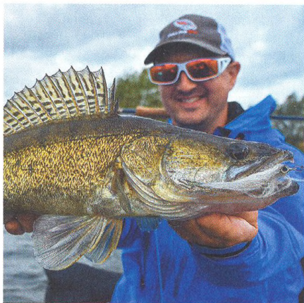
04 Cesta k candátovi