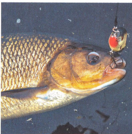
68 Jelec tloušť vs. jelec jesen