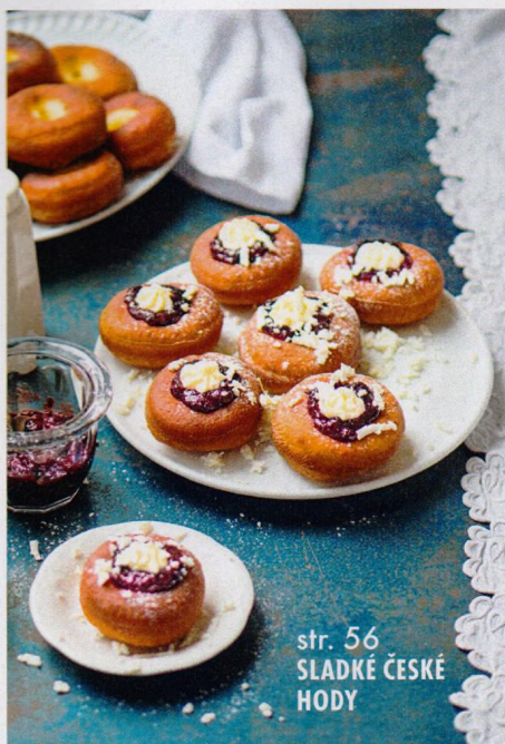
str. 56 SLADKÉ ČESKÉ HODY