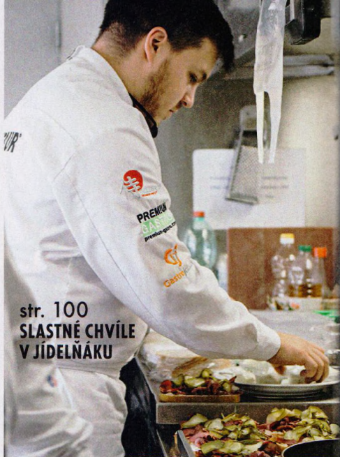
str. 100 SLASTNÉ CHVÍLE V JÍDELNÁKU