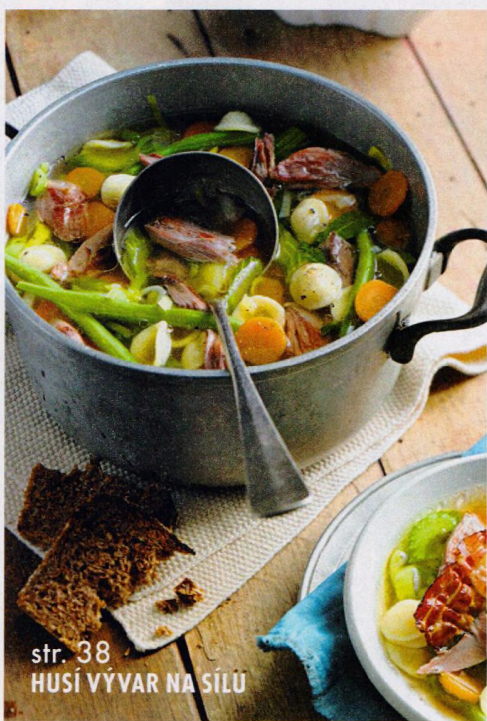
str. 38 HUŠÍ VÝVAR NA SILU