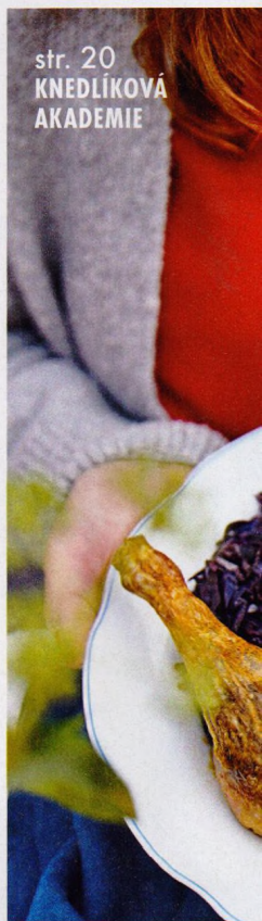
str. 20 KNEDLÍKOVÁ AKADEMIE