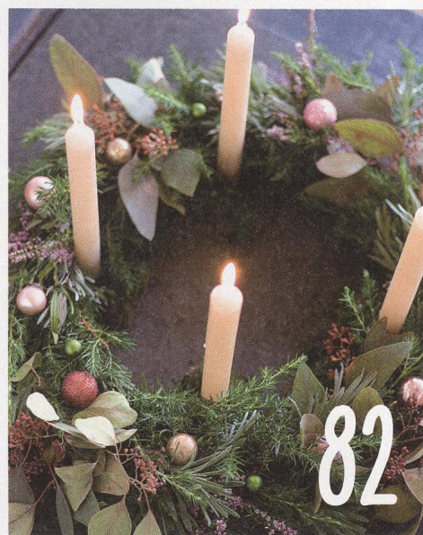
ADVENTNÍ VĚNEC Z VŘESU