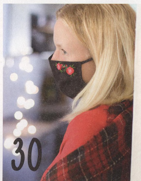
VYŠIVANÉ ROUŠKY JAKO DÁREK