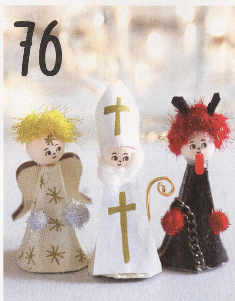
TVOŘENÍ Z PAPIŘU