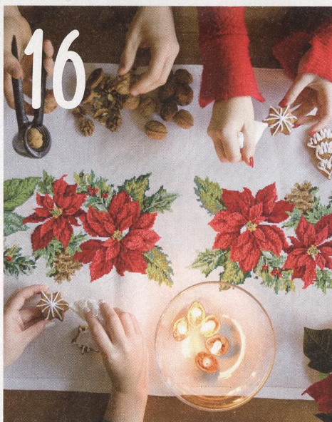
SPOLU U JEDNOHO (VYŠIVANÉHO) STOLU