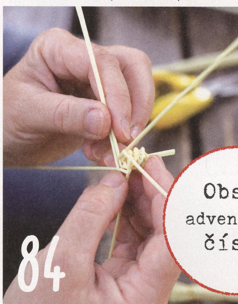
ROZHOVOR O PLETENÍ ZE SLÁMY