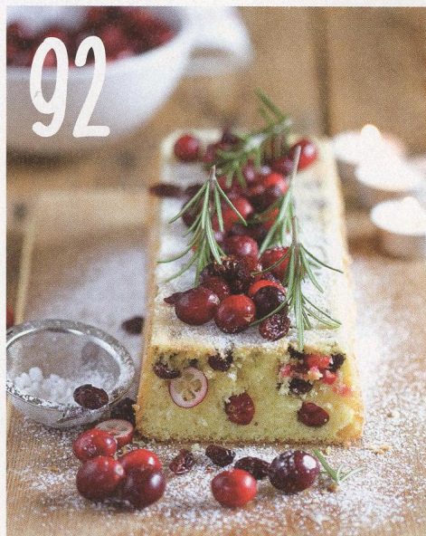
VYNIKAJÍCÍ BRUSINKOVÝ CHLEBÍČEK