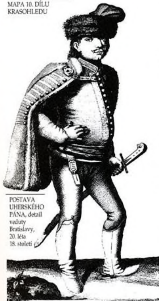
POSTAVA UHERSKÉHO PÁNA, detail veduty Bratislavy, 20. léta 18. století