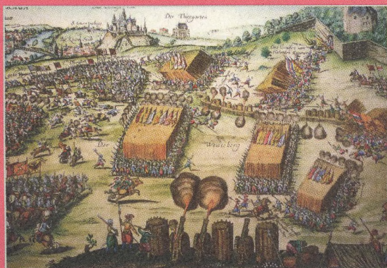
Bitva na Bílé hoře (str. 17)

Vavříny ověčený Ferdinand II. Štýrský na pamětní medaili z roku 1622 (str. 8)