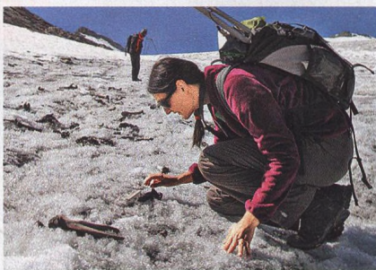
ve službách archeologie