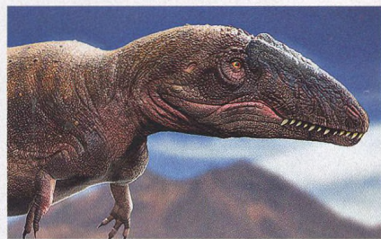
Historie Země pod našima pohama