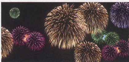
Utrpení v hávu radostných barev