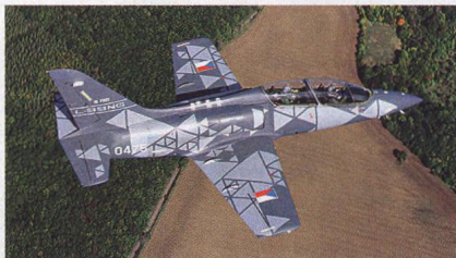
Česko má po letech nový proudový letoun