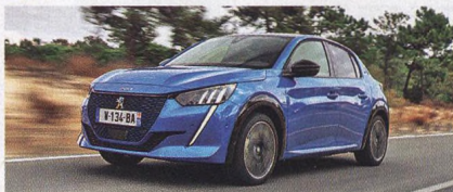
Elektrická spanilá jízda