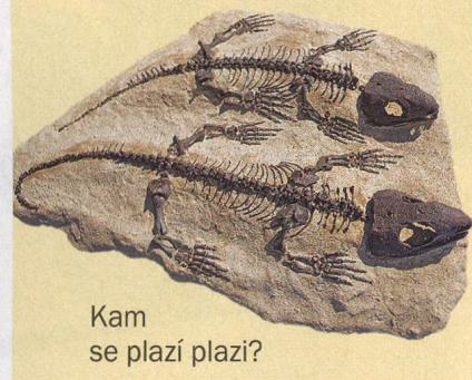
Kam se plazí plazí?