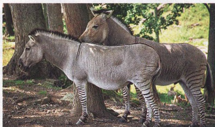
Jak se žije v pruhovaném pyžamu?