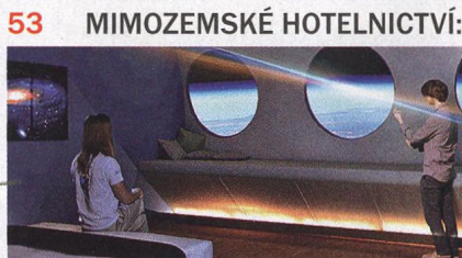
Takhle vypadá projekt prvního vesmírného hotelu...