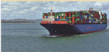
Technologický div, který propojil oceány