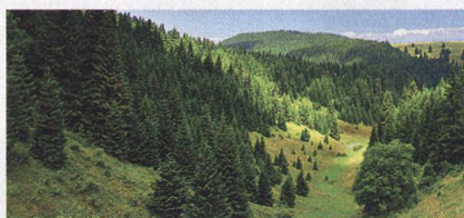
Každý strom se počítá...