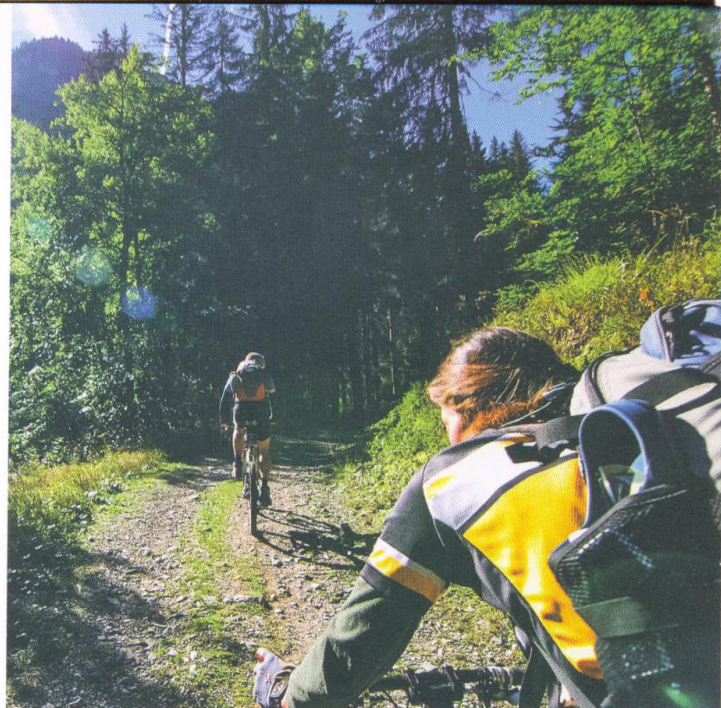
Ve znamení medvěda kolem pohoří Brenta (túra 40).