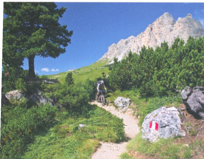
Okruh Sella Ronda (túra 55) vede typickou krajinou italských Dolomit: zelené louky v kontrastu se strmými skalami.