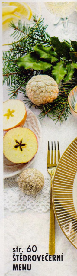
str. 60 ŠTĚDROVEČERNÍ MENU