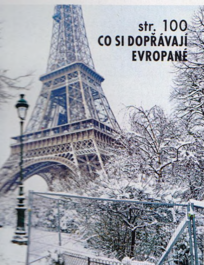
str. 100 CO SI DOPŘÁVAJÍ EVROPANÉ