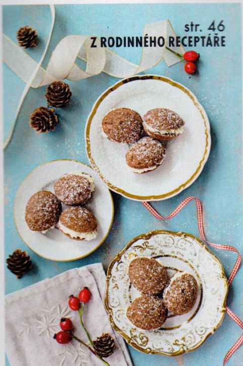
str. 46 Z RODINNÉHO RECEPTÁŘE