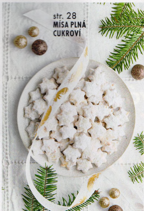
str. 28 MÍSA PLNÁ CUKROVÍ