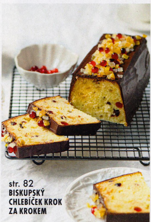
str. 82 BISKUPSKÝ CHLEBÍČEK KROK ZA KROKEM