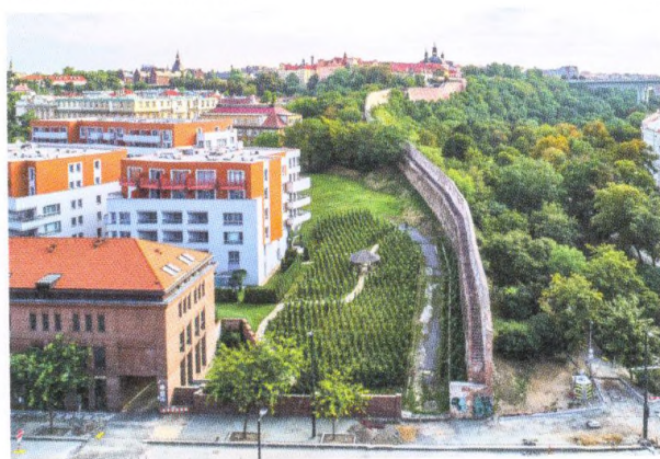
Vinice spojující minulost s budoucností 200