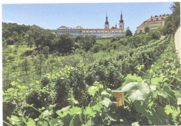
Strahovský klášter a jeho vinice 132