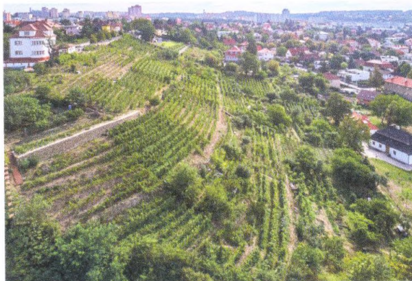
Vinice Modřany Z arcibiskubství k zahrádkářům 180