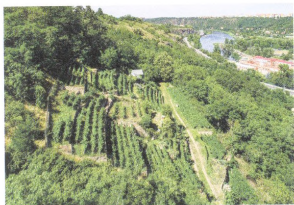
Baba, romantická zřícenina i biovinice 160