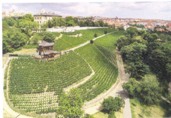
Grébovka, elegantní dáma se šarmem Hollywoodu 216