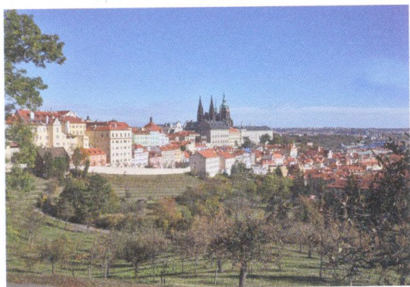
Svatojánská vinice nad sadem mandloní 150