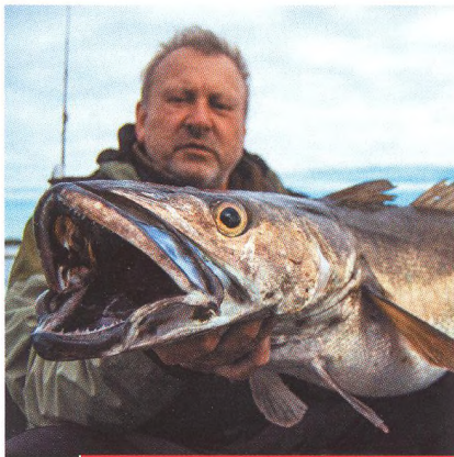
04 Na Sever / duševní detox