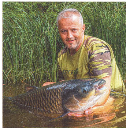
08 Amur / bojovník z Dálného východu