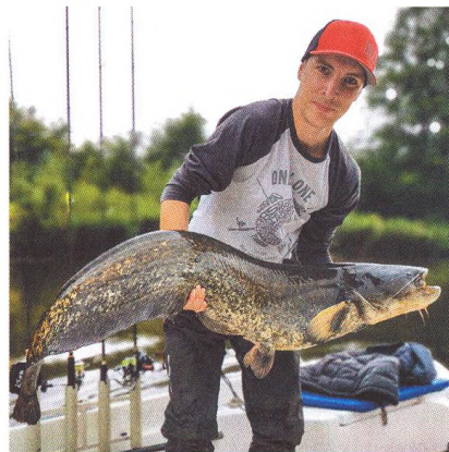
62 Přívlač v době covidové