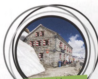
63-64 CHATY VE ŠVÝCARSKU