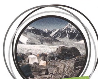
39-41 KANGCHENJUNGA! – POSLEDNÍ VELKÁ HORA