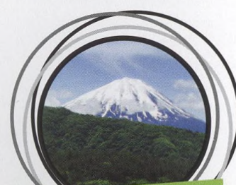
73-88 TÉMA: JAPONSKÉ HORY