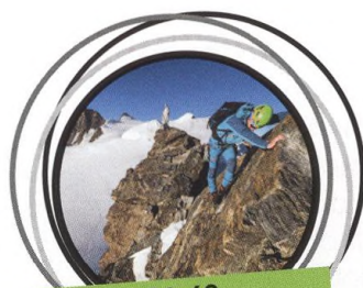
56-62 ALPSKÉ ČTYŘTISÍCOVKY VI