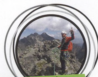
42-46 VYSOKÉ TATRY IV: ŠIROKÁ VEŽA, MOTYKA