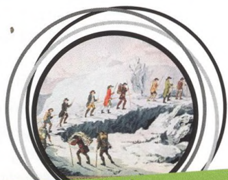
11-12 ALPINISMUS JAKO KULTURNÍ DĚDICTVÍ