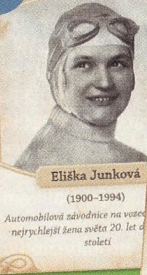
Eliška Junková (1900-1994) Automobilová závodnice na vzrost nejrychlejší žena světa 20. let 20. století