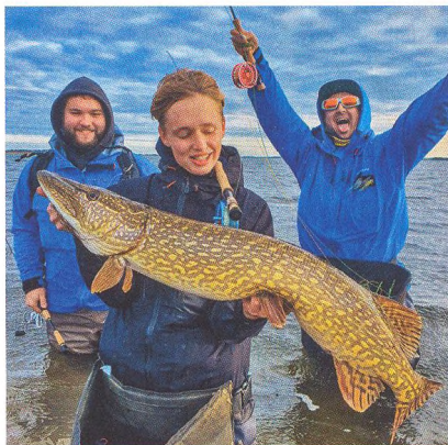
04 Taktiky do studené mělké vody