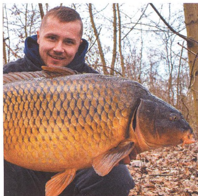
22 Vysoký tlak aneb lov v chladné vodě