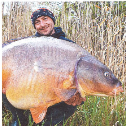
14 Ach tak! Otestujte si zimní kapařské teze