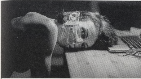
12| Homeoffice a my