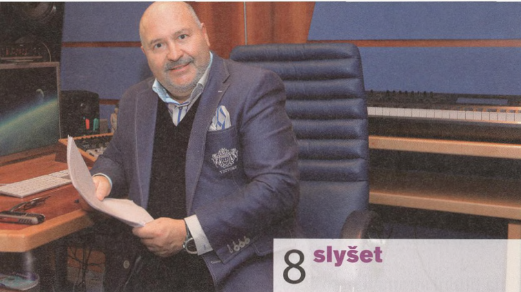
MICHAL DAVID zpěvák a producent