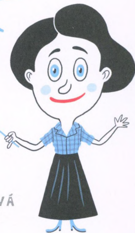
ROSALIND FRANKLINOVÁ Výzkumnice molekulární struktury DNA