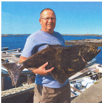
20 Rybaření ve středním Norsku / Halibut