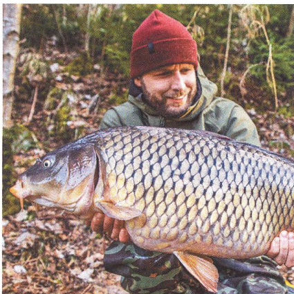
04 V zajetí klidu malé řeky