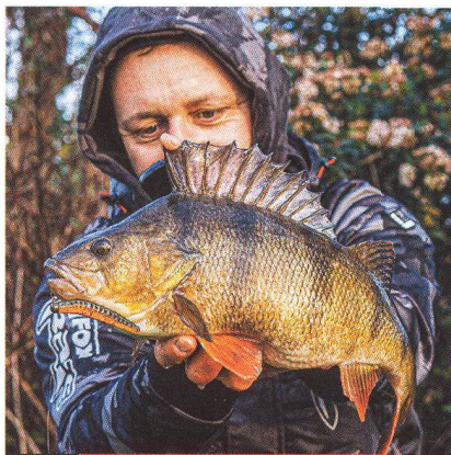
20 Ned rig / návazec, který umí zázraky