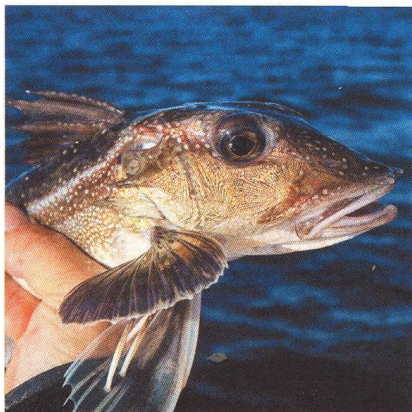
26 Rybaření ve středním Norsku / Pyskouni a štitníci