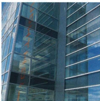
Dvě věže – nová dominanta Holešovic