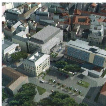
Janáčkovo kulturní centrum v Brně