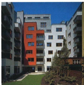
Úspěšný dům na nároží