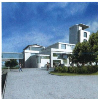
Nad barrandovskou skálou se jasní