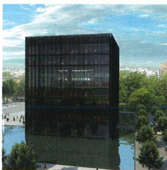
Černá věž nad vodní plochou