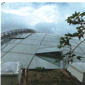
Džungle pod kopulí