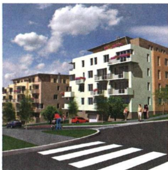
Půl tisícovky nových bytů v Brně