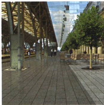
Pražské Hlavní nádraží se chystá na rekonstrukci