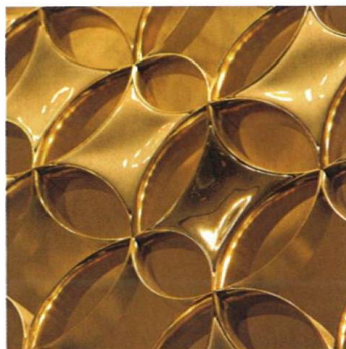
Ozdobná mříž pro obchodní dům Louis Vuitton v Paříži