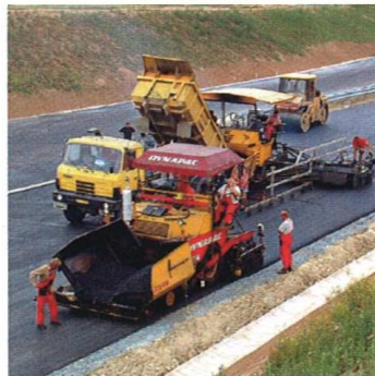
Do Česka se stahuje stavařská Evropa