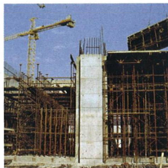
Nesprávně postavené lešení může ohrožovat život pracovníků