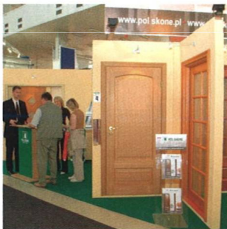
Stavební veletrhy zahajují