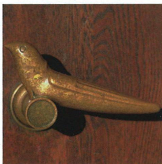
Světový unikát v hermelínu