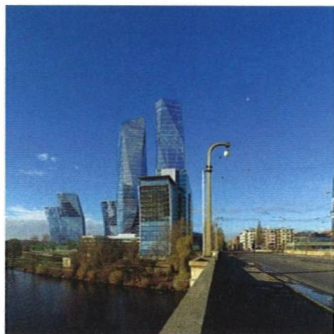
Mrakodrapy u Vltavy