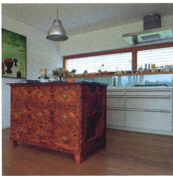
Dům v trávě