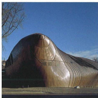
Architektura je boj Struggle for Architecture