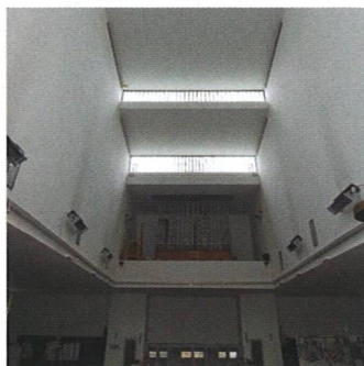
Gradovaná zbožnost Graduated Dignity