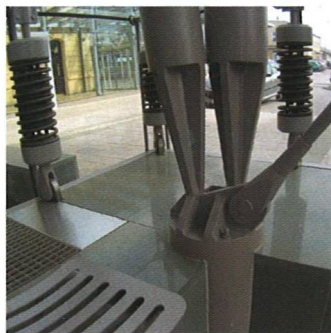
Průzračné nádraží Transparent Railway Station