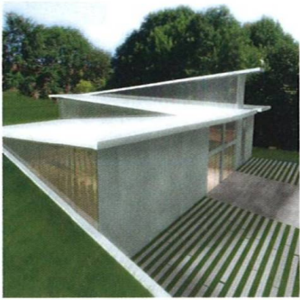
Svatostánek ve svahu The House of Worship on the Slope