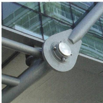
Zavěšená konstrukce A Suspended Structure