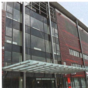
Stadion Slavia The Slavia Stadium