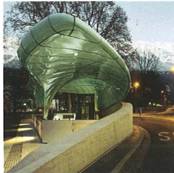
Zaha Hadid – podruhé v Innsbrucku Zaha Hadid – Second Time in Innsbruck