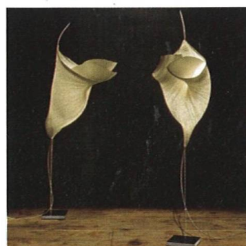
Umění iluminace The Art of Illumination