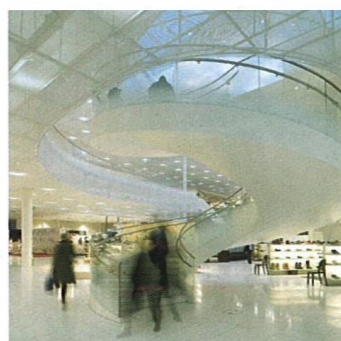
Architektonicky osobitné nákupní centrum An Architecturally Distinctive Shopping Centre