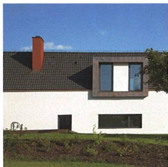
Dům v harmonii s krajinou A House in Harmony with the Landscape