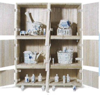
Badatelské výpravy Exploring Expeditions