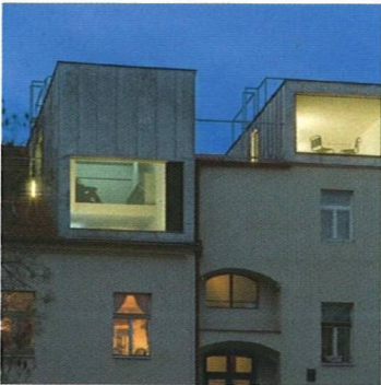
Bydlení v kontejneru Living in a Box