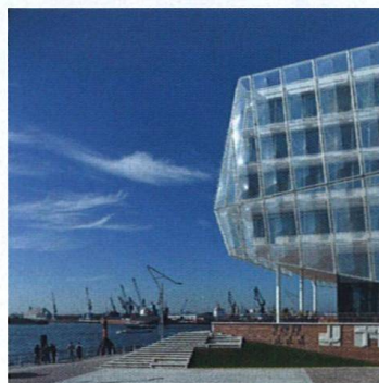
V přístavu In the Port