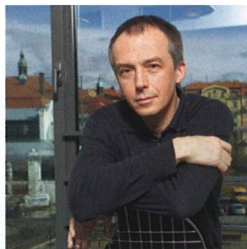
Hledání konsensu Finding Consensus