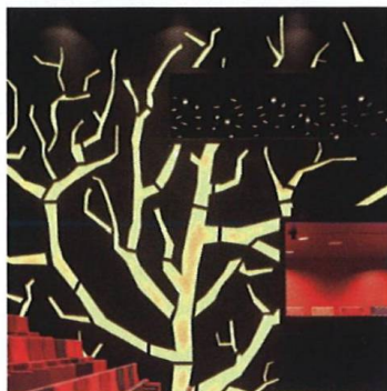
Katalánské divadlo Catalan Theatre