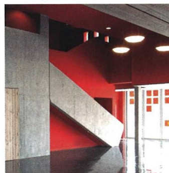
Alpské siluety v betonu a dřevě Silhouettes of the Alps in Concrete and Wood