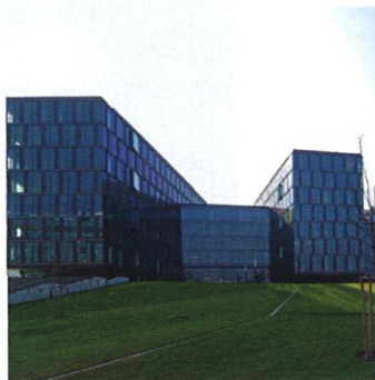
Umění prstokladu The Art of Architectural Purity