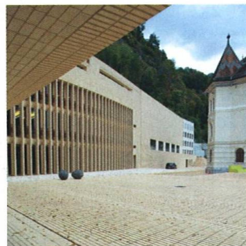
Parlament jako chrám Parliament as a Cathedral