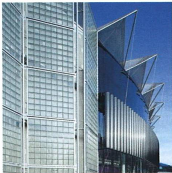
Ocelový diatom Steel Diatom