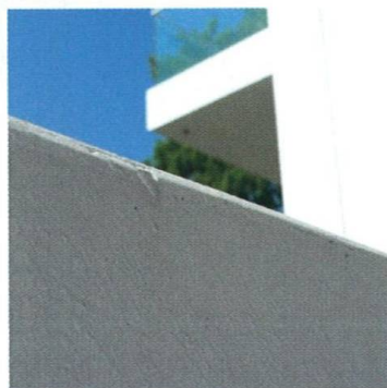
Beton, který čistí vzduch Concrete, which Cleans the Air