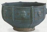
Perská mísa na ovoce ze 13. st.