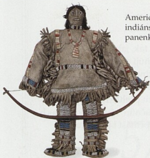
Americká indiánská panenka