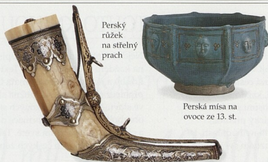
Perský růžek na stříelný prach