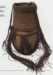
Egyptská nádobí na vodu