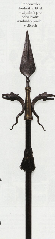
Francouzský doutník z 18. st. – zápalník pro odpalování stříelného prachu v dělech