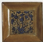
Čínský talíř z období dynastie Ming