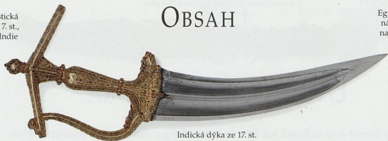
Indická dýka ze 17. st.