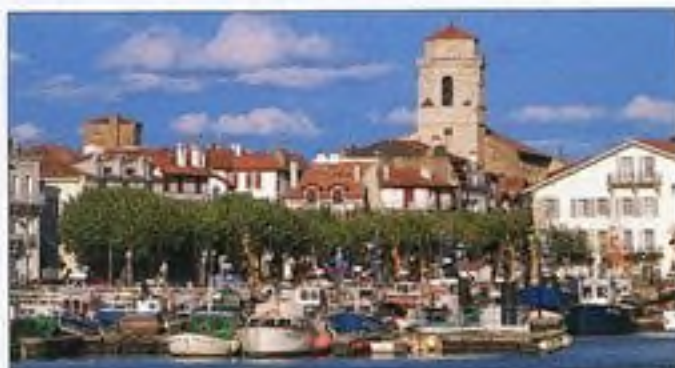
Rybářská vesnice St-Jean-de-Luz v Pyrenejích