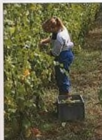
Vinobraní v Alsasku