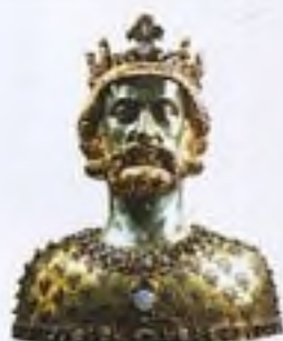
Busta Karla I. Velikého