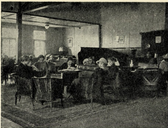
U krbu v dívčím foyer.