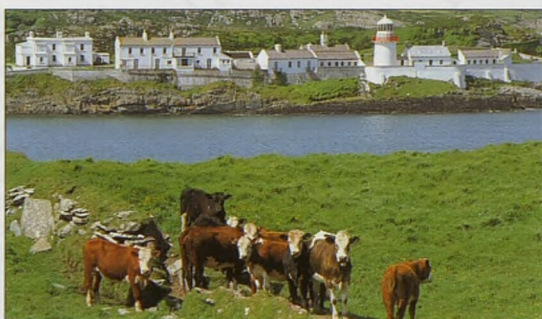
Maják na Spanish Pointu nedaleko mysu Mizen Head (viz str. 159)