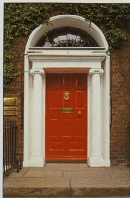
Georgiánský portál na náměstí Fitzwilliam Square (viz str. 67)