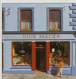
Průčelí hospody v Dingle (viz str. 149)