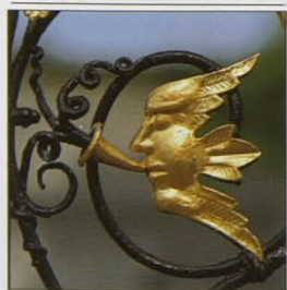
Detail brány Chorus Gate v Powerscourtu (viz str. 126–27)