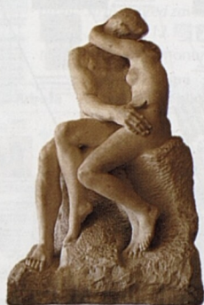
Auguste Rodin: Polibek (1886)