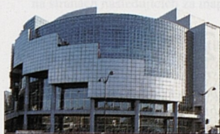
Opéra National de Paris Bastille