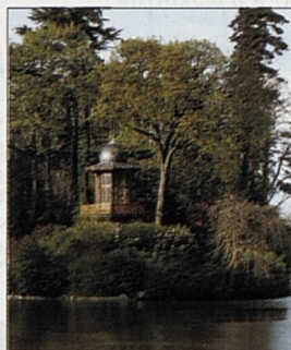
Ostrov v Buloňském lesíku