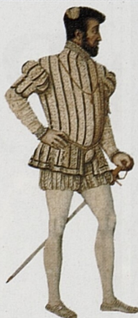
Jindřich II. (1547-59)