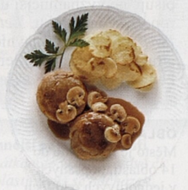
Noisettes – jehněčí kotlety