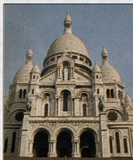
Sacré-Coeur na Montmartru