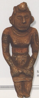
SEVEROAMERICKÁ HROBOVÁ FIGURKA

PŘEHLED 132-157 ZÁZNAMY 158-185 SLOVNÍČEK A BIBLIOGRAFIE 186-187 REJSTŘÍK 188-191 PODĚKOVÁNÍ 192