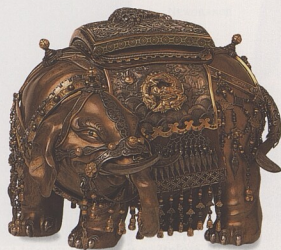
JAPONSKÝ HOŘÁK NA KADIDLO

TICHOMOŘÍ A AUSTRALASIE 92-93 VELIKONOČNÍ OSTROV 94-95 AUSTRÁLIE 96-97 POLYNÉSIE A MIKRONÉSIE 98-99