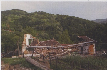
Povodně z přívalových srážek mohou způsobit destrukci i domů, které stojí na kopci daleko od řeky.

Uspěchané zabydlení Použití nevhodných materiálů Chybné provedení drenáže Nedostatečné větrání Neodstraněné obklady Nedokončení oprav Vysoké spotřeby