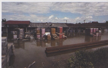
Povodně se neomezuji pouze na obytné domy.