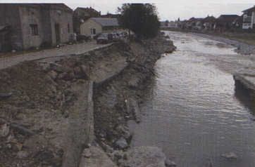
Poničená koryta řek jsou po povodních častý jev.