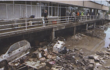
Někdy přichází voda tak rychle, že zaplavuje nejenom domy, ale i auta.