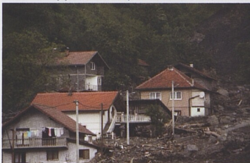
Voda s sebou může přinést bláto a kamení.

Územní plánování Mapování povodňových rizik Mapy povodňového nebezpečí Mapy povodňových ohrožení Míra povodňového ohrožení Mapy povodňových rizik Jak rozumět těmto mapám?