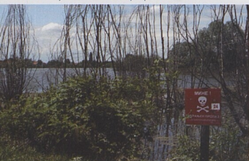
Zaplavené minové pole při povodních v Bosně.