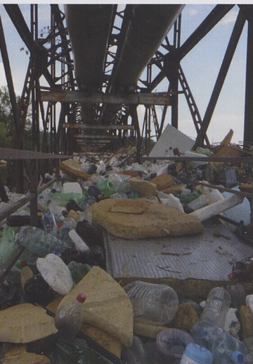
Povodeň s sebou přináší mnoho odpadků.