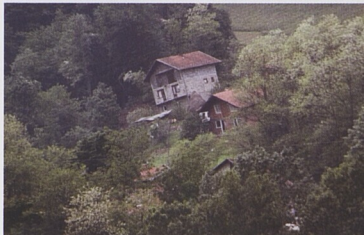
Vydatné srážky mohou způsobit nestabilitu svahů a jejich celé sesuvy i se stavbami na nich.

Prožívání Potřeby Spolupráce s dobrovolníkem Rozhovory a chování druhých Co pomáhá Limity svépomoci