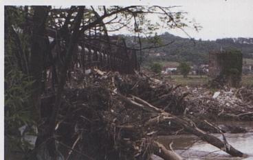
Zachycené dřevo na mostě působí jako překážka a může lokálně zhoršit povodeň.