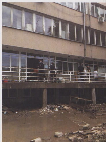
Voda ve městech působí značné škody.