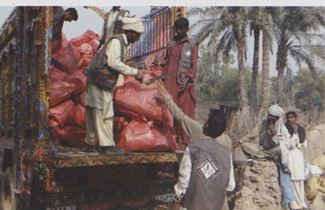
Pracovníci Člověka v tísni distribuují humanitární pomoc po povodních v Pákistánu 2010.