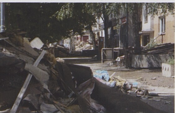
Zničené vybavení na ulici po povodních.