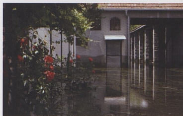
Některé obrázky mohou působit až idylicky, ale zdání klame.