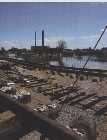
Velké povodně mohou poškodit důležitou dopravní infrastrukturu.