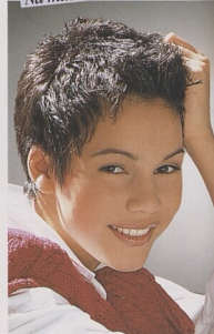
Na mastné vlasy krátké