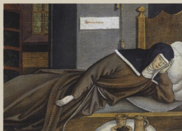
Odpočívající františkánská jeptiška, Germ. Nationalmuseum