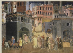
Městská scéna; detail fresky, A. Lorenzetti, Siena, radnice