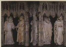
Truchliční mniši na tumbě náhrobku Filipa Smělého, Dijon, Musée des Beaux-Arts