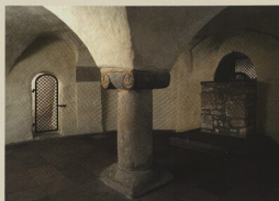
Kulda, býv. klášterní kostel sv. Michala, krypta