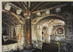
Řím, rané křesťanské katakomby na Via Latina