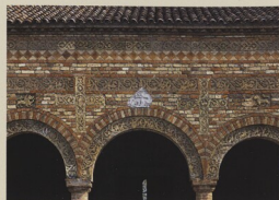
Pomposa, býv. benediktinské opatství, předsíň