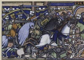
Křížácká bible, New York, Pierpont Morgan Library