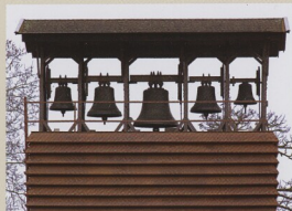
Taizé, zvonohra ekumenické komunity