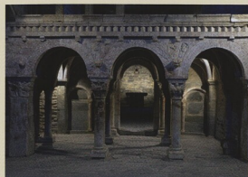
Serrabone, býv. převorský kostel, tribuna pro zpěváky