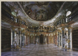
Ulm-Wiblingen, knihovna bývalého benediktinského opatství