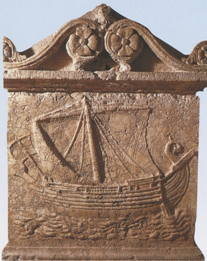
Reliéf zobrazující fénickou obchodní loď, 2. st. př. n. l.