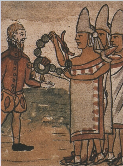
Montezumovi vyslanci vítají Cortése (Diego Durán).